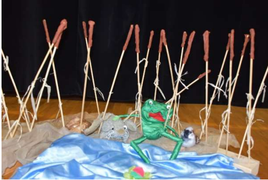
Musical zum Bilderbuch «mutig, mutig»